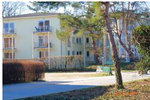
Blick von der Promenade zum Balkon oben rechts.