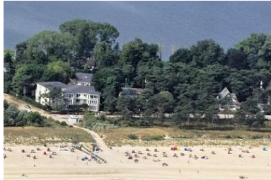
Luftbild von der Ostsee. Im Hintergrund liegt der Schloensee.

Ostseebad Heringsdorf, Maxim-Gorki-Str. 36