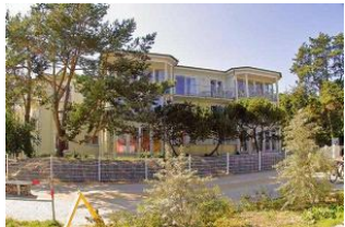
Blick von der Promenade zum Objekt.

Direkt an der Ortsgrenze Heringsdorf / Bansin gelegen, entstanden im Jahr 2002 zwei Strandvillen auf einem ca. 3.300 qm großen Grundstück mit altem Baumbestand und direkter Ostseelage. Das Appartement liegt im 2. Obergeschoss mit großzügiger Ausstattung und einem herrlichen, freien Blick auf die Ostsee. Hier wohnen Sie in der ersten Reihe und können die Aussicht vom Balkon oder Wohn- und Schlafzimmer genießen. Ein Parkplatz für das Fahrzeug rundet das Angebot ab.