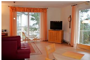
Blick in das Wohnzimmer und zum Balkon.