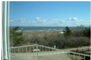
Balkon mit freiem Ostseeblick.